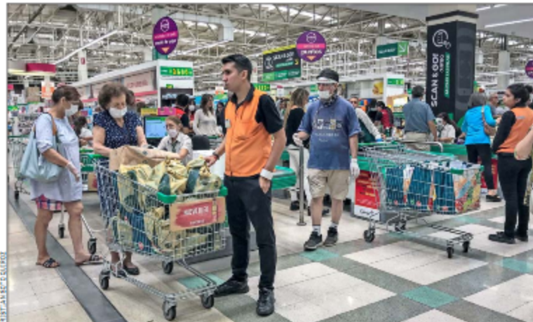
La demanda en supermercados ha implicado que las cadenas hayan tomado iniciativas para limitar la compra de ciertos productos, como desinfectantes.

El llamado a permanecer en los hogares para evitar nuevos contagios por el brote del covid-19, al que se sumó en los últimos días un toque de queda, ha significado un cambio de conducta en la forma de gastar de los chilenos. Según un estudio de Fintonic, app de finanzas personales que monitorea los desembolsos de casi 180 mil usuarios en el país, en la semana del 16 al 22 de marzo el gasto medio en supermercados se incrementó 45%, versus el mismo lapso de 2019, pasando de un ticket promedio de $33.264 a $48.222.