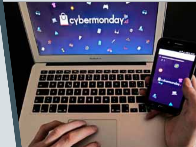
Sin contar la categoría supermercados, el retail registró un crecimiento semanal de 123,9%.

mente se conocen. Lo mismo ocurre con proveedores, trabajadores y vecinos, todos conectados (24x7). Esto marca una diferencia de clase en la comprensión del problema estratégico. Ya no se trata de qué debemos hacer mejor, sino de qué manera distinta debemos hacerlo. Las organizaciones interactúan con comunidades, siendo clave entonces la filosofía política, ya que es necesario administrar la vida en común. Así las cosas, hoy aplica la célebre frase: "A cualquier parte que vayas, serás una polis". De esta manera, contratar un gerente general, comprar o fusionar una empresa, innovar en desarrollo de nuevos productos exigen incorporar un enfoque de filosofía política. Ahora nos vemos cara a cara con comunidades conectadas que ejercen influencia y coordinan acciones que, además, instalan ideas fuerza que condicionan el proceso de toma de decisiones estratégicas. Apelando a Arendt, las organizaciones ahora son un vecino que debe aportar a la vida en común. De lo contrario, quedan fuera de la vida pública y, por lo tanto, aisladas, comprometiendo así su propósito y la creación de valor económico para los dueños y para la sociedad. Se trata ahora, más bien siempre, de construir comunidad.