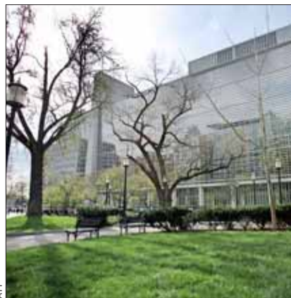
Esta es la controversia más reciente de la institución con sede en Washington.

El Banco Mundial manejó mal las denuncias de acoso sexual presentadas por varias mujeres contra un alto funcionario, que se convirtió luego en ministro en Costa Rica, según las conclusiones de un tribunal interno del banco. El caso involucró informes perturbadores que datan de 2009, según los cuales el funcionario invitó a jóvenes colegas a habitaciones de hotel, trató de engañarlas para que lo besaran y les hizo comentarios inapropiados. El funcionario fue degradado pero no despedido de su cargo, según el tribunal administrativo que representa el último recurso para los empleados que presentan quejas. Esta es la controversia más reciente en esta institución financiera con sede en Washington, luego de que una investigación interna revelara que funcionarios habrían presionado a economistas para alterar los resultados de su informe "Doing Business", que clasifica a los países según sus políticas favorables a las empresas.