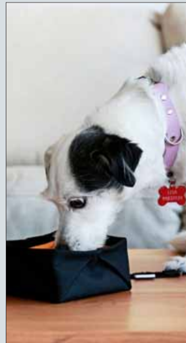
La póliza de Woof también contempla cobertura por daños a terceros.