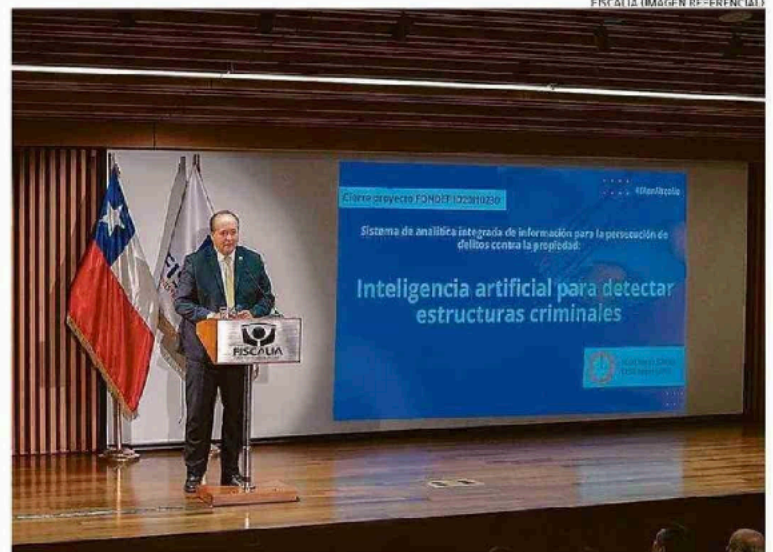
FISCALÍA ES UNA DE LAS INSTITUCIONES PIONERAS EN IMPLEMENTAR LA INTELIGENCIA ARTIFICIAL.

"Lo que más nos interesa es que esa información que se genera pueda ser útil en el análisis criminal. Es decir, aquella información que vamos desestimando porque no hay sufi-