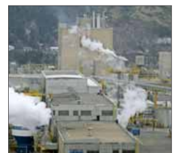
La Planta Constitución detuvo sus operaciones.

La compañía del grupo Angelini aún no estima mermas por estas detenciones en las faenas mencionadas.