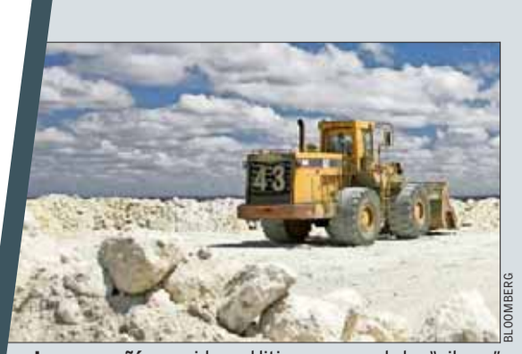
La compañía considera el litio como uno de los "pilares" de su cartera de materias primas.

El cierre de la jornada en los mercados no fue tan auspicioso como su inicio: Los principales indicadores terminaron con retrocesos: el Dow Jones cayó 0,53; el S&P 500 bajó 0,54% y el tecnológico Nasdaq perdió 0,66%.