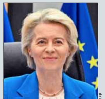
La presidenta de la Comisión Europea, Ursula von der Leyen.

En el tercer lugar aparece la primera ministra italiana, Giorgia Meloni, seguida por la flamante Presidenta mexicana, Claudia Sheinbaum. En la quinta posición aparece la ejecutiva estadounidense Mary Barra, directora ejecutiva de General Motors.