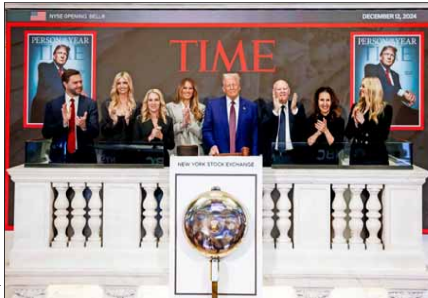
El evento coincidió con la selección de Trump como "Persona del Año" de la revista Time.

Pese al entusiasmo, al cierre de los mercados los principales índices anotaron bajas. El Dow Jones cayó 0,53% y el Nasdaq retrocedió 0,66%.